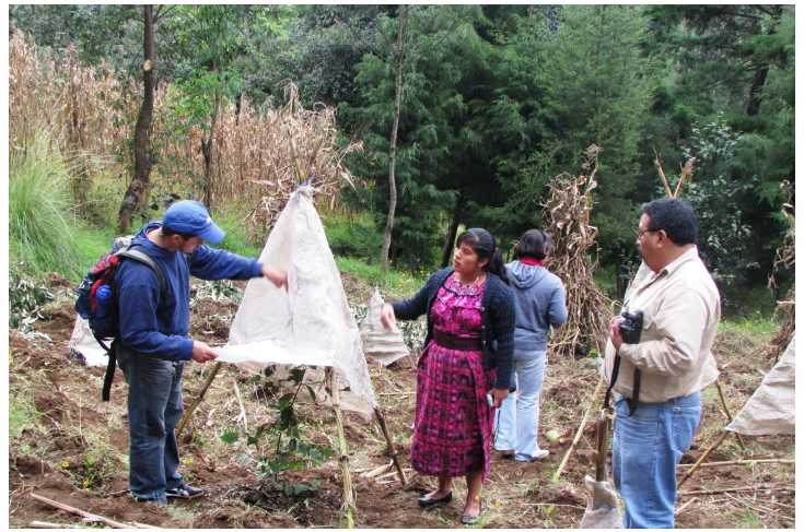
Capacitación para la construcción de estructuras para la protección de árboles contra heladas en el municipio de San Miguel Sigüilá, Quetzaltenango.